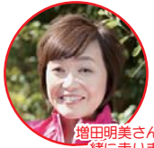
増田明美さんが一緒に走ります